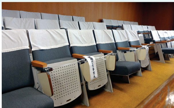
席の間隔を空けてご着席いただいています