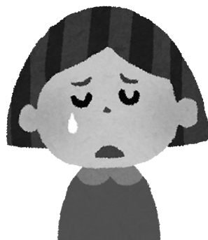
コロナ禍で深刻化する子どもの貧困・児童虐待

DV担当者との情報共有連携については妊婦・乳幼児・児童等が含まれる場合は子ども未来課が担当し、複合的な案件が多いことから、関係各課で情報を共有し、連携しながら対応しているところです。