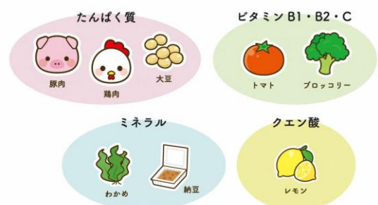
夏バテ対策に効果的な栄養素