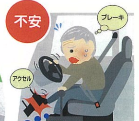
交差点での出会い頭