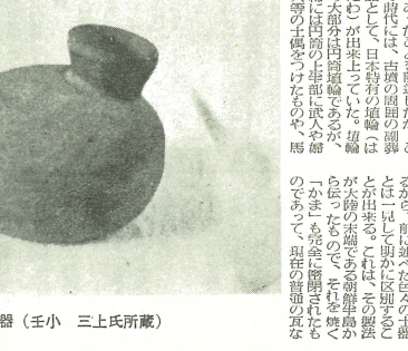
祝部土器 (王小 三上氏所蔵)

祝部の土器は、縄文時代の土器から古墳時代の土器まで続いています。特に、祝部の土器は、縄文時代の土器から古墳時代の土器まで続いています。