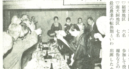
健康を祝しあう壬生郷友会会員

農業委員会は、農業生産らなつて、選挙による委員の定数は、六月の議会で条例が改正された十八名になり、前回から六名減りになりました。また選挙区は従来通り地区別に設けられて、選挙区別の定数は、 一、稲葉地区 五名 二、南大岡地区 七名 三、案内内（適当な地区）もよりの選定は停留場よりの位置（百平方メートル以上）の場合に建築士の設計書が必要、 手数料は、概木、 紙（指定印刷紙または銀行）で購入し確認申請書上欄の手数料のところへはつてくださ、 期、違反は、 期、違反は、