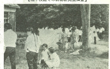
【稲中校庭での幹部研究会風景】

稲葉地区の子供会幹部 研究会が七月三十一日 と八月一日の二日間に わたり稲葉中学校校庭 で、稲葉委員会、町青 少年教育委員会、町青 少隊、稲葉地区子供 会、ボーイスカウト 壬生第一団で、ス カウト