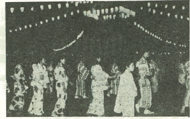
【名物になった壬生納涼踊り】

明るい光の下 輝いている みんなの顔 嬉しそうな 笑い みんな踊っている 趣きにも 夜空に映えた 博が眩しい。